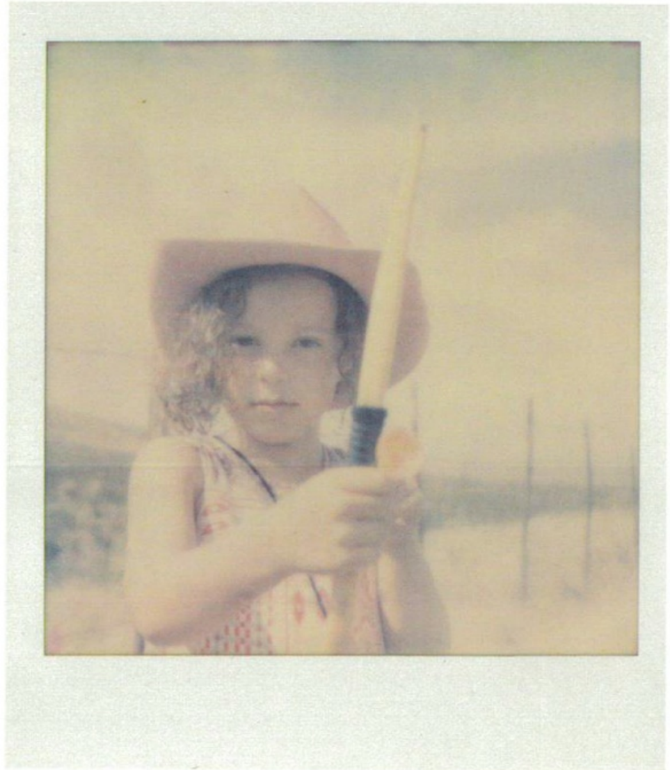
Fig. 2 (s/p)

La deuxième image (Fig.2) est la photographie sur laquelle on voit Memphis, la sœur du jeune garçon, avec un chapeau rose, un arc et une flèche. Ces trois derniers éléments sont des cadeaux que la jeune fille reçoit des quatre enfants perdus en échange de la carte, de la boussole, de la torche, des jumelles, des allumettes et du couteau suisse dont son frère s'était muni avant de s'enfuir avec sa sœur et qui, d'après lui, leur seraient utiles en tant que kit de survie pendant leur traversée dans le désert 48 . La transaction que la jeune fille effectue avec les enfants perdus se passe le lendemain de leur rencontre, pendant que son frère est encore endormi. Quand ce dernier se réveille et s'aperçoit que les enfants perdus sont déjà partis et ont emporté ses affaires avec eux, il éprouve un moment de colère passagère, qui s'apaise lorsqu'il se rend compte, qu'en réalité, ni lui ni sa sœur n'auront plus besoin de ces objets, puisqu'ils sont sur le point de rencontrer leurs parents, d'être sauvés a contrario des enfants perdus qui fort probablement en auraient besoin dans leur pèlerinage.